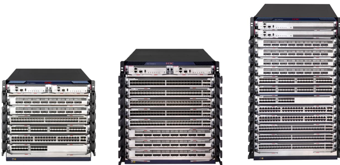
S10500X-G 系列以太网核心交换机

H3C S10500X-G 系列交换机产品是新华三技术有限公司（以下简称 H3C）面向云计算数据中心核心、下一代智慧园区核心专门设计开发的产品。S10500X-G 基于 H3C 自主知识产权的 Comware V7 操作系统，为客户提供可信、安全的平台。主控、网板、风扇、电源等关键器件冗余设计，提供电信级高可靠保障。支持高密 GE/10GE/25GE/40GE/100GE 以太网端口， VXLAN、MDC、M-LAG 和 IRF2 等主流技术，融合了 MPLS VPN、IPv6、无线、流量分析等多种网络业务。同时，H3C S10500X-G 采用绿色节能的环保设计工艺，符合“限制电子设备有害物质标准（RoHS）”。